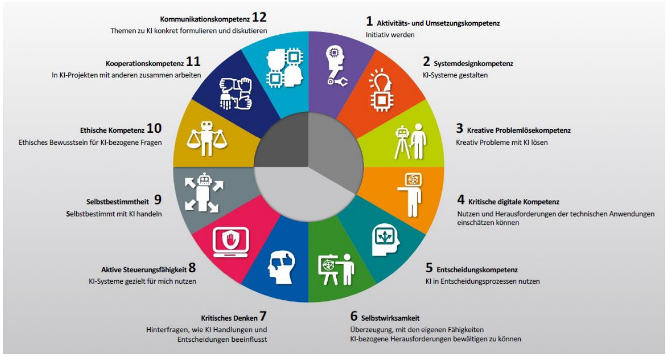
Abbildung: © Ehlers, U.-D., Lindner, M., Rauch, E. (2023): AIComp – Future Skills für eine durch KI geprägte Welt, Karlsruhe; Creative Commons BY – NC – ND; www.ai-comp.org

beschreibt nach Kompetenzfeldern geordnet, worauf es im beruflichen und privaten Alltag im Umgang mit AI ankommt: